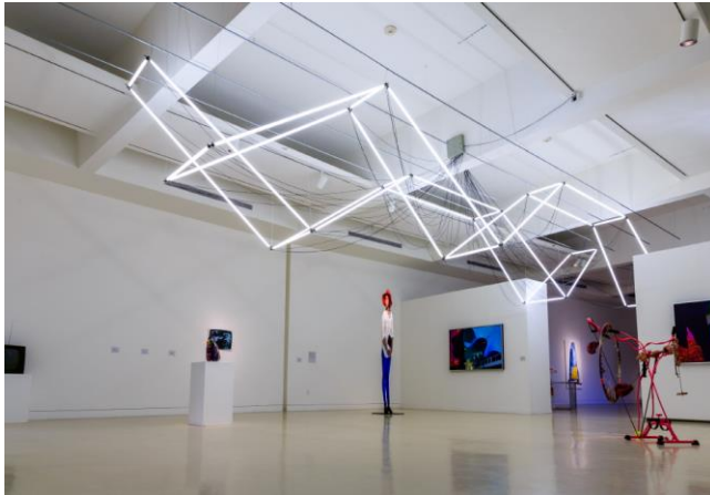
Torrance Art Museum <Dae-Bak, Super Cool>