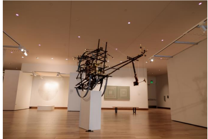
Southern Utah Museum of Art <Encounter Korea>