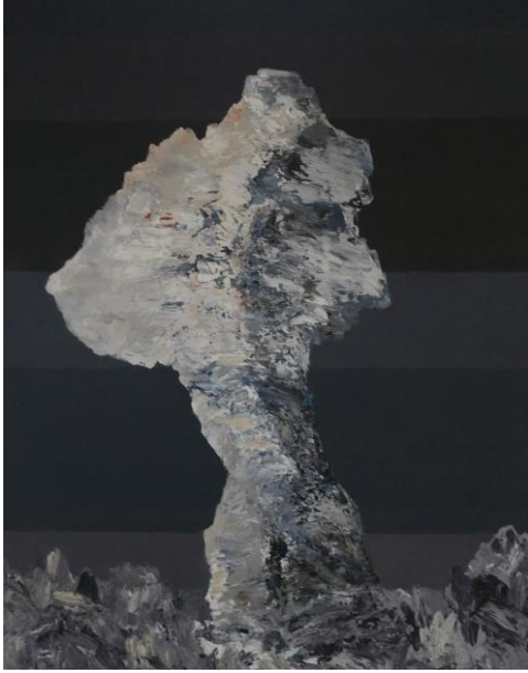
Hoodoo, 30 x 24, 2018 Acrylic, Ink, Gel on Canvas