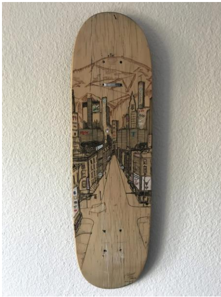
Absolution at Calvary, 2017

캘럽 이는 남가주출인 한인입양아 예술가이다. 작가의 작품들은 그의 입양과정, 타인과의 관계, 다양한 커뮤니티를 둘러싼 일상적인 경험에서 영향을 받았다. 또한, 그의 창의적인 스타일은 텍스처 기반의 상징주의, 색상의 의미와 초상화 리얼리즘 등 세가지로 구분되어 작품을 통해 전달된다. 그가 바라는 것은 관객도 각각의 제작 된 예술 작품을 통해 작가의 머릿속을 여행을 하게 하는 것이다. 작가의 예술적 비전은 사람들이 사회 정의 문제, 개인 신념 및 창조적 인 세계관에 대해 말하도록 격려하는 것이다. 어린 시절부터 스케이트 보딩 문화에 영향을 받은 작가는 스케이트 보드 아트 자체에 대해 알리기 위한 맞춤형 스케이트 보드 아트를 제작하고, 한 목적지에서 다른 목적지로 여행하는 라이더의 정체성에 대한 아트 워크의 연관성을 보여주고 있다.