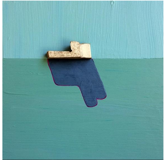
BLP-101, series (7-8pcs), 8x8x1, 2017, Acrylic, Found wood, on wood