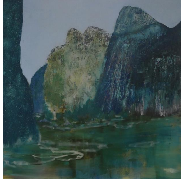
Still Water, Still Mind 36 x 36, 2018 Acrylic and archival ink on canvas