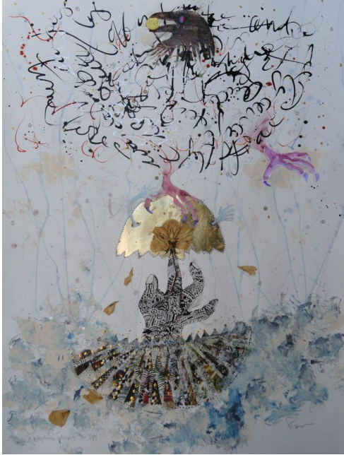
Cracked, 30x22 inches, 2016 Mixed Media on paper