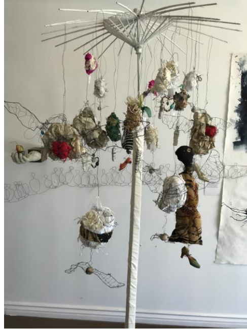
Tree of My Hopes and Dreams, 2018 Mixed Media