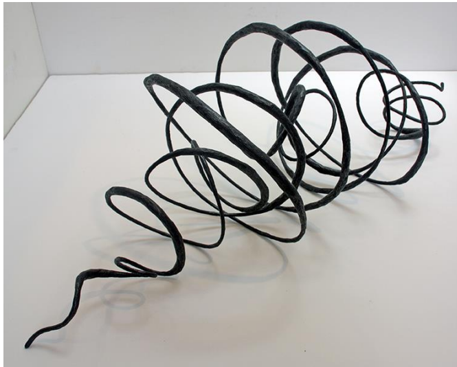
Graphite Doodle 1, 14x40x14 inches, 2015 graphite, acrylic, papier mache, wire