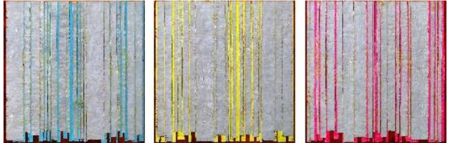
데이비드 강 Pluralism, 2015