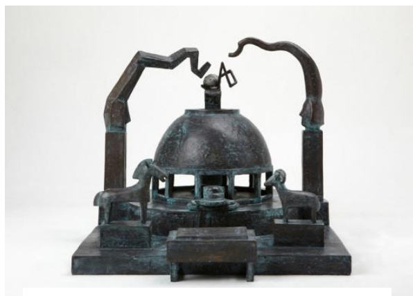
오광섭 Having Been to King's Tomb 48 x 66.5 x 42 cm

신라 토기는 자연의 모습을 닮았다. 찍어낸 듯 정교하고 세밀하지 않지만 그 기품있는 실루엣은 자연과의 교감을 통한 많은 이야기를 담고 있다. 신라 토기는 “인공적인 것보다는 자연적인 것이, 차가운 정밀함보다는 인간적인 따스함이, 세부적인 느낌보다는 전체적인 느낌 (이상억, 2008, p. 98)”을 우선하는 작품 세계가 가장 잘 나타난 미술품이다. 신라 토기는 솔직하고 편안하면서도 조화롭고 단아하며 기품이 있다. 자연이 만들어 낸 자연의 한 조각이다. 표면에 더해진 기하학적인 디자인은 그 소박함으로 두드러짐이 없다. 전시된 신라 토기에게서 정적인 고요함을 느낄 수 있다면 이를 둘러싸고 있는 현대 작품들에게서는 동적인 움직임이 느껴진다. 그러나 그 움직임은 과하지 않고, 흐트러짐 없는 고대 토기와 완벽한 조화를 이룬다. 서로 다르지만 거름이 없어 소란스럽지 않고, 같지만 반복됨