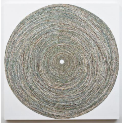
영신 Circle No. 515, 48x48 inches