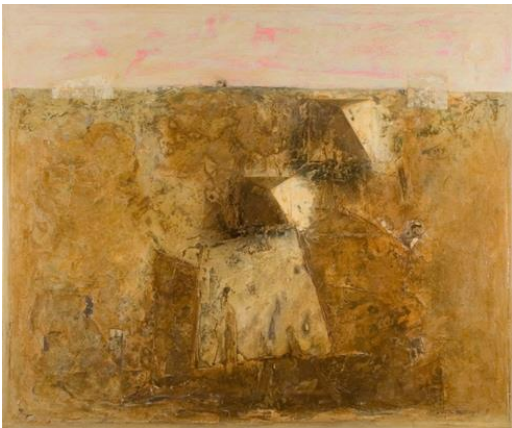
김휘부 Geo Series 2005 50x60 inches