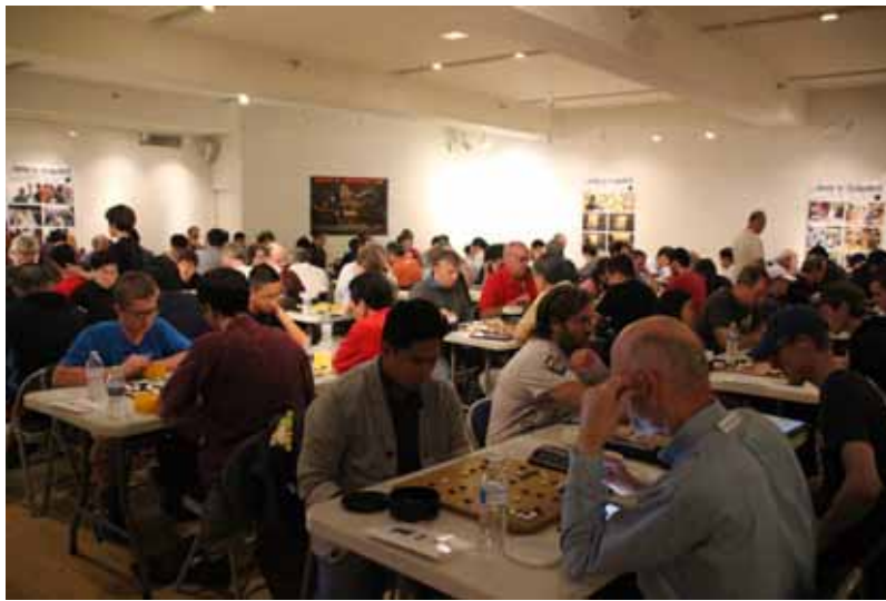
(2017 남가주 오픈 바둑대회 사진자료)