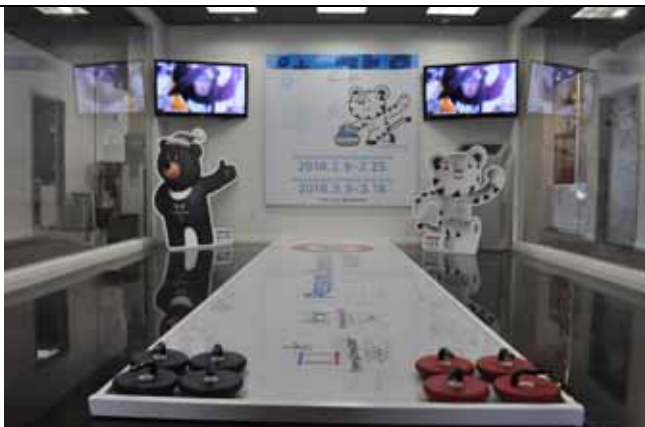
평창동계올림픽 LA홍보관 (걸림체험존)