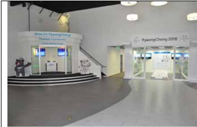
평창동계올림픽 LA홍보관 전경