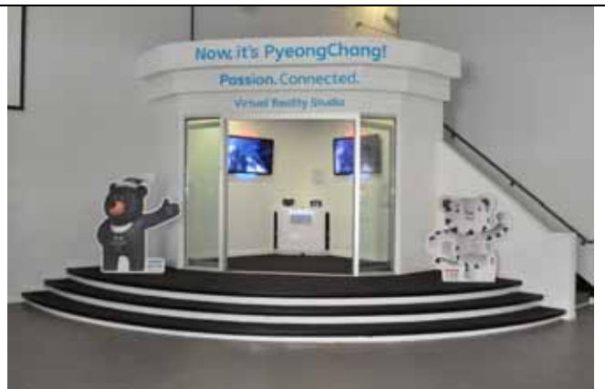
평창동계올림픽 LA홍보관 (VR 체험존)