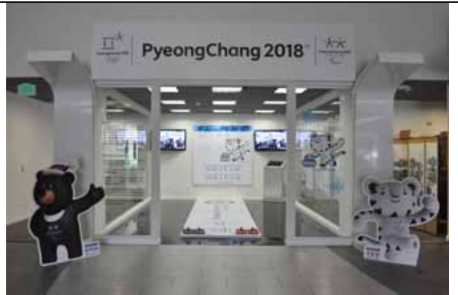
평창동계올림픽 LA 홍보관 (영상존 및 포토존)