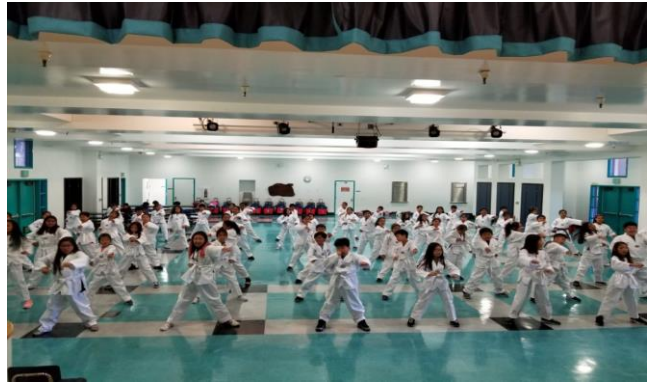
2018 태권도교육 사진자료