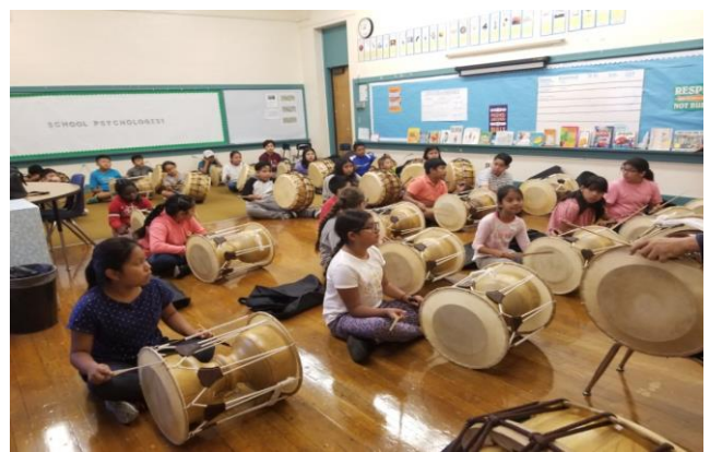
2018 국악교육 사진자료