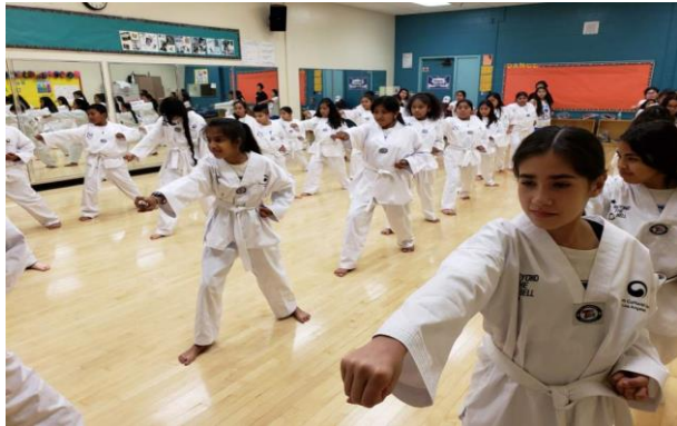
2018 태권도교육 사진자료