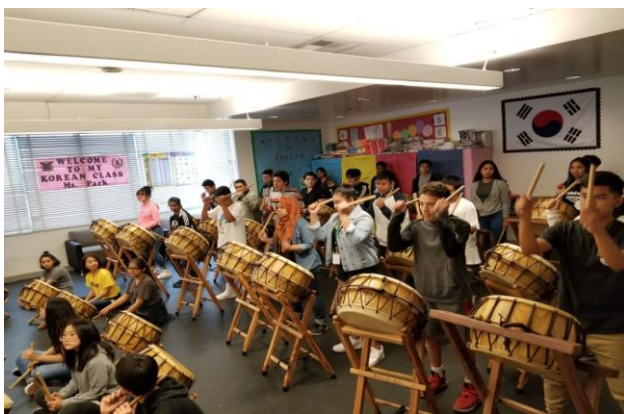
2018 국악교육 사진자료