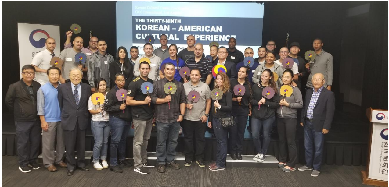
(LAPD Workshop 자료사진/ Nov. 1 st , 2018)