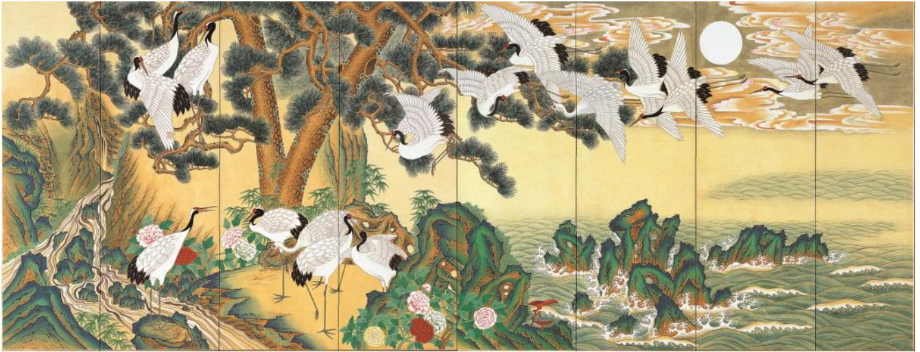
송규태/“송학도“ 120×392 inch 8폭 병풍

LA한국문화원(원장 박위진)은 2019년 7월 전시로, "아름다운 우리 민화전 (Minhwa: The Elegance of Korean Folk Paintings)" 전시회를 7.12(금) 부터 7.25(목)까지 LA한국문화원 2층 아트갤러리에서 개최한다. 이번 전시회는 LA한국문화원과 (사)한국민화협회(회장 박진명)가 주최하고, 한국민화협회 LA지부(회장 최용순) 주관으로, 한국 전통민화의 대가 파인 송규태 화백을 비롯하여 (사)한국민화협회 회원 9명과 한국민화협회LA지부 회원 16명 등이 참여하여 총 40여점의 민화작품을 전시할 예정이다.