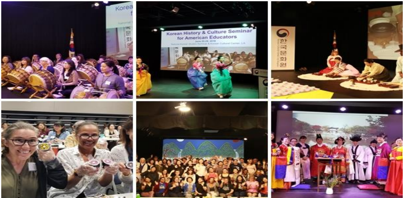
(2018 한국 역사 · 문화 교육자 세미나 자료사진 / June 25-29, 2018)