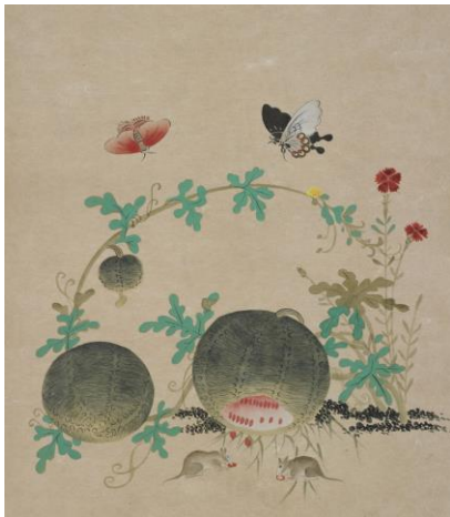
송창수 / 수박과 들쥐