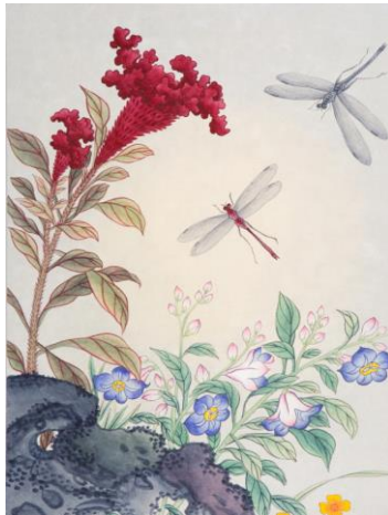
최용순 / 조충도