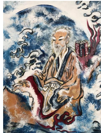
호다 메이사미 / Medicine Scholar God