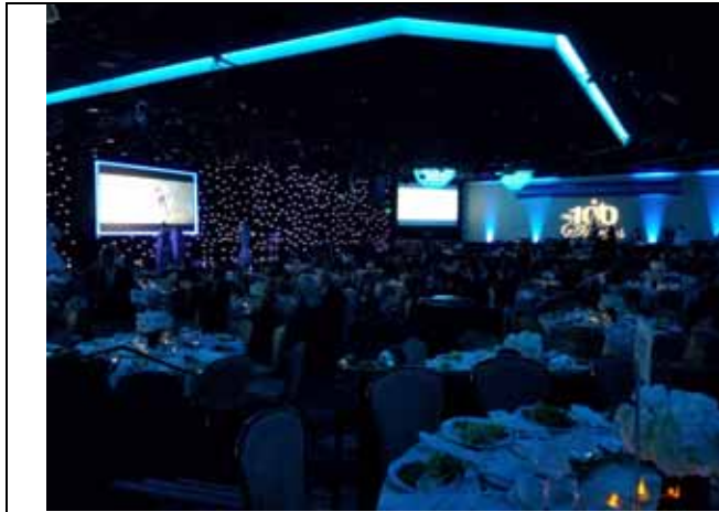
평창동계올림픽 홍보 동영상 상영