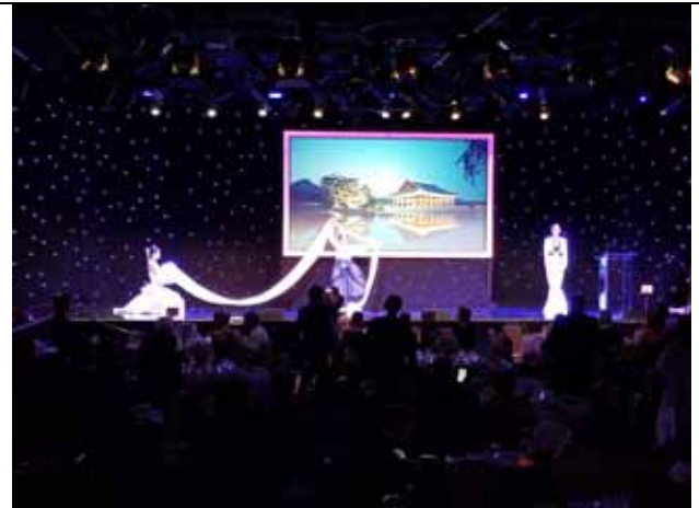
평창동계올림픽 성공적 기원을 위한 특별공연