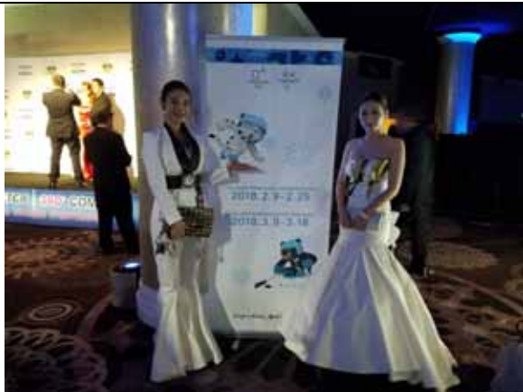
태권도와 성화를 주제로 한 드레스