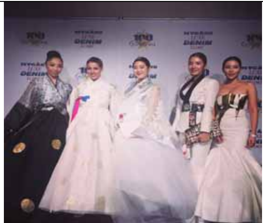
한복 등 한국문화 홍보 활동 참가자