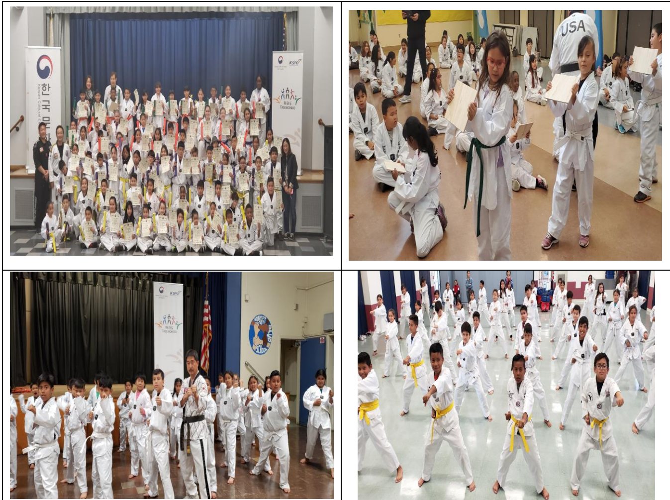
2019 공립학교 태권도 프로그램 교육 사진자료