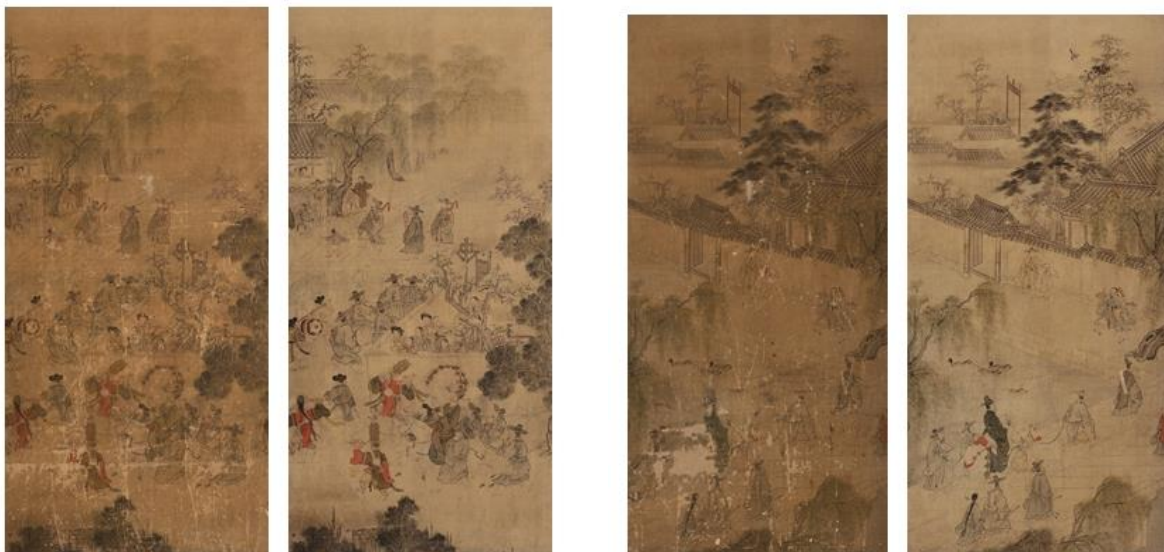
응방식 (좌측 원본-우측 복원본) 한림검수 (좌측 원본-우측 복원본)

<평생도>는 조선시대 사람이 태어나 한 평생을 보내면서 소원했던 가장 경사스러운 순간을 그린 것이다. 8폭의 그림은 돌잔치부터 혼인하여 과거에 급제한 후, 관직생활에서 승승장구하여 정1품 최고 품계인 정승에 올라 회혼식까지 치르는 과정을 보여준다. 화목한 가정에서 태어나 좋은 배필을 만나서 좋은 직장을 가지고 명예로운 자리에 올라 영화와 장수를 누리는 모습은 조선시대뿐 아니라 요즘 우리가 바라는 인생의 모습과도 비슷하다.