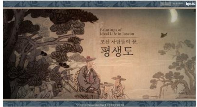
평생도 영상 이미지