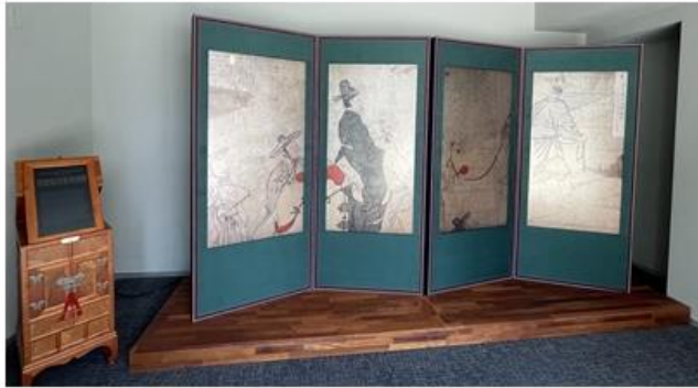
1층 상설전시실 미디어병풍 및 경대 키오스크