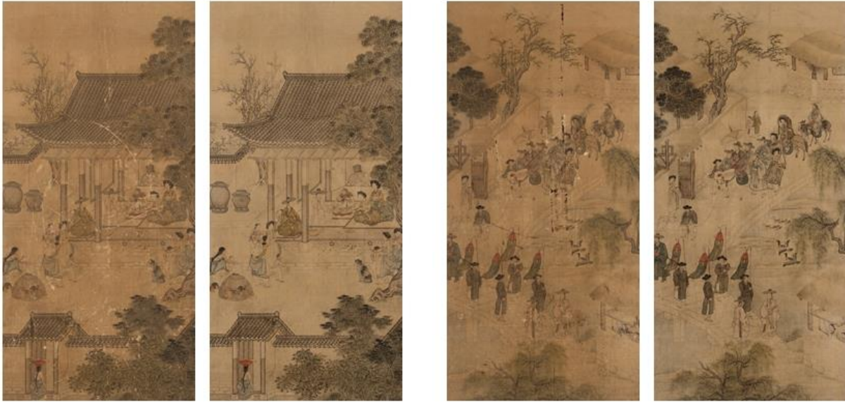
호도호연 (좌측 원본-우측 복원본) 혼인식 (좌측 원본-우측 복원본)

LA한국문화원(원장 정상원)은 국립중앙박물관(관장 윤성용)에서 제작한 ‘조선 사람들의 꿈, 평생도’ 미디어 병풍을 해외문화홍보원(원장 김장호)의 지원으로 9월 1일(목)부터 LA한국문화원 1층 상설 전시실에 설치하고 일반에 공개한다.